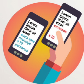
Desconfía de las cadenas de mensajes