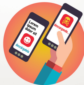
No instales una app para ver una noticia