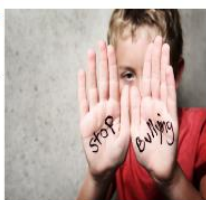
Otro perfil marcado

Pero además de VÍCTIMA y AGRESOR/A también están implicados en el ciberacoso los OBSERVADORES (personas que dentro de su entorno, callan y no denuncian el acoso, consintiendo pasivamente sus consecuencias).