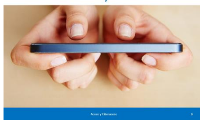
Semejanzas y diferencias entre acoso y ciberacoso

Dentro de la definición de ciberbullying , es importante identificar también las diferencias y semejanzas, entre el acoso 'cara a cara', presencial y el virtual (ciberbullying), resumidas en el siguiente cuadro: