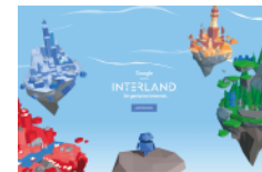
Sé genial en Internet