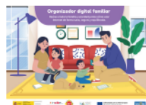
Organizador digital familiar