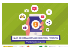
Herramientas de control parental