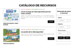
Tipo de recurso: Juego